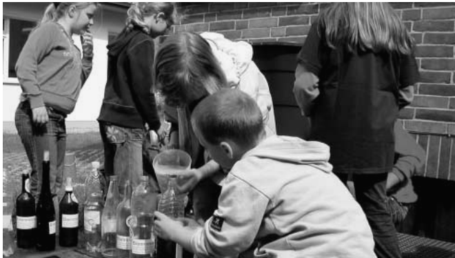
Grundschule Garßen bei Celle: Die Kinder lernten, wie man aus Wildkräutern ein biologisches Spritzmittel gegen Blattläuse herstellen kann, das den heimischen Vögeln nicht schadet. Die Brennnesseljauche entwickelte sich zum echten „Verkaufsschlager“ und trug außerdem noch zur Information der Bevölkerung bei.

Anmeldung: Reichen Sie den Anmeldebogen mit Kurzinformationen zum Konzept bis zum 15.10.2007 bei der Landeskoordinatorin ein. Die Teams in den Regionen (Anschriften siehe unten) überprüfen danach die Tragfähigkeit des Konzeptes entsprechend der Teilnahme Kriterien. Sie nehmen ggf. Kontakt mit Ihnen auf.